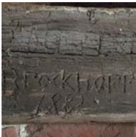
Kirche Zirchow, innen